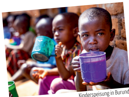
Kinderspeisung in Burundi

Infos zu den Vorträgen in Rendsburg werden rechtzeitig bekanntgegeben.